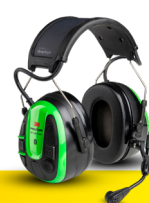
3M™ PELTOR™ WS™ ALERT™ X+