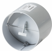
Kallrasspjäll Ø98x74 Art. Nr 8127-1