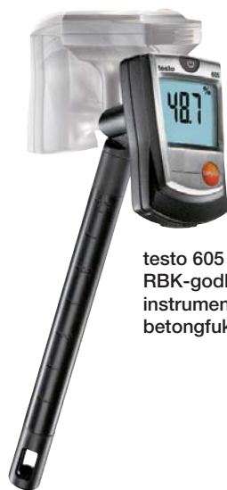
testo 605 RBK-godkänt instrument för betongfuktmätning