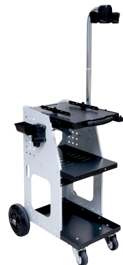
ref. 051331 + 052284 UNIVERSAL 800 + Överhängande arm