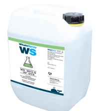
ref. 062511 kylmedel specialsvetsning - 5 l