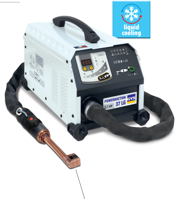
En komplett induktor på 90°