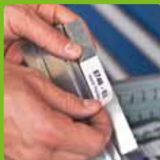
Många användning- sområden