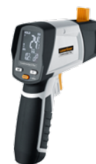
CondenseSpot Plus + batterier