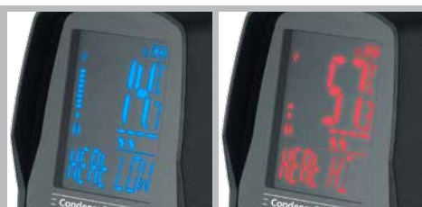
Belyst LC-display med färglarmsfunktion