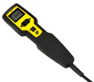
ER 1 multifunktionellt fjärreglage med inbyggd display