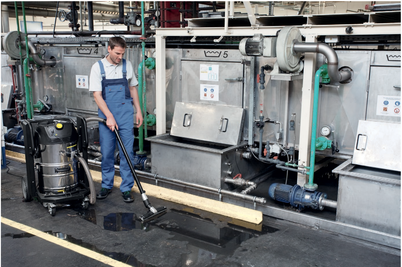
IVC 60/24-2 Tact 2